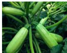
CRECIMIENTO DE FRUTOS