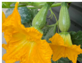
PRIMERAS FLORES CUAJA